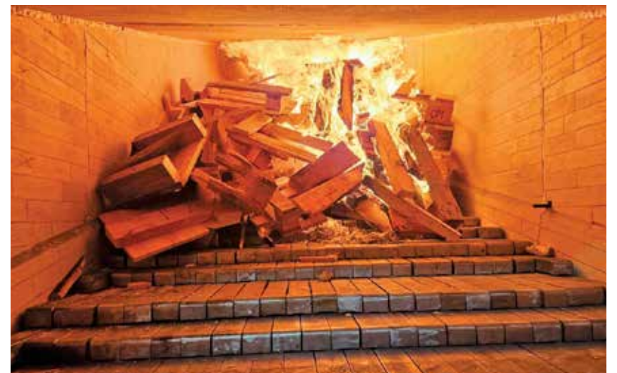
Fokus Pet let Javnega holdinga Maribor Oglasna priloga Izdal: Večer mediji, september 2025